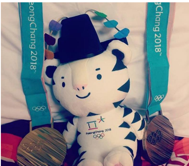
Anais Bescond @BescondAnais · 21 févr. Ce soir, je dors en bonne compagnie !!! Tonight i sleep with nice compagnie !!! ift.tt /ZEKSAUE